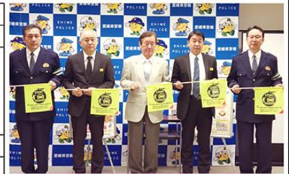
愛媛県遊技業協同組合 横断旗贈呈式 (R6.4.12)