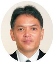
愛媛県警察本部 警察本部長 山浦 親一

その一方で、信号機のない横断歩道の手前での車両の停止率については、全国平均を上回り、また、自転車乗車用ヘルメットの着用率については、二年連続で全国第一位となるなど、一定の成果を収める